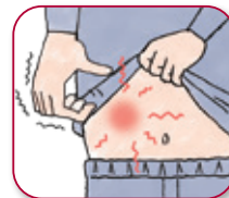
注射部位 そう痒感